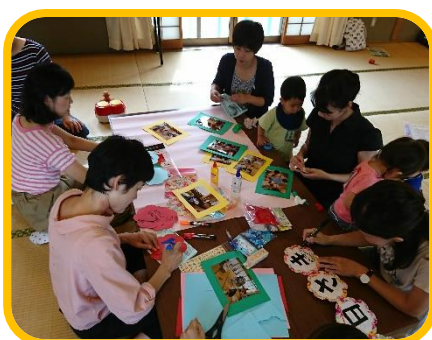
福祉まつり用にサロンのパネルを作りました。 みなさん、センスがすごい！！