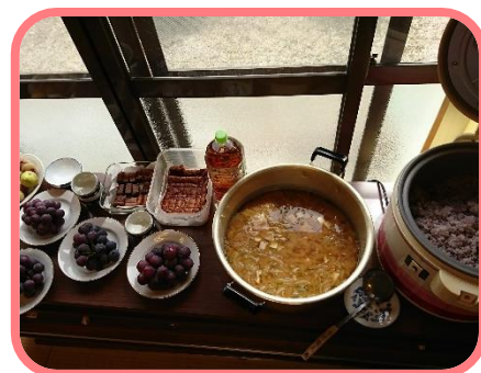
お日さま卒業ママがボランティアで お昼ご飯を作ってくれます。