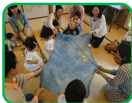
昔懐かしいわらべうたを歌いながらの 和やかな時間です。