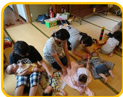
卒業ママボランティアさんが、座学の時や ご飯を食べる時などに小さい子の面倒を見て くれるので、ゆっくりできますよ。