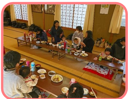
みんなで食べるご飯は美味しいです。