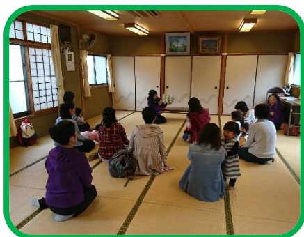
毎年恒例 あひる文庫さんの大型紙芝居。 みんな静かに興味津々