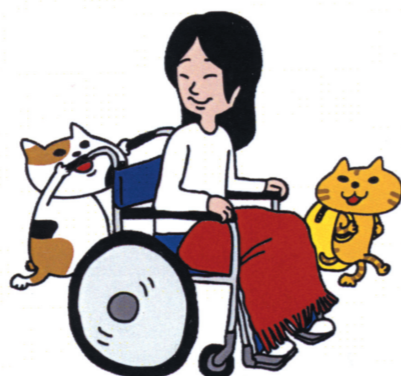
病院内受診の付添い