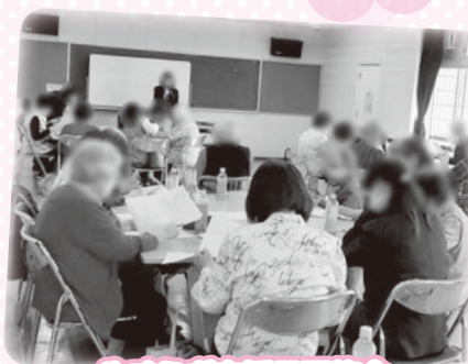
やすらぎ支援員研修会