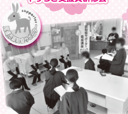
認知症サポーター養成講座