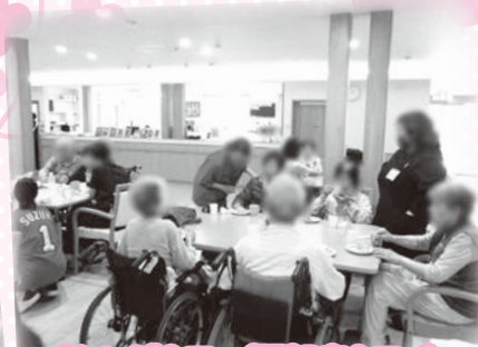
オレンジカフェ(認知症カフェ)