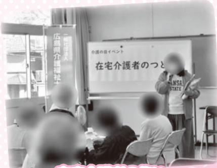
在宅介護者の集い