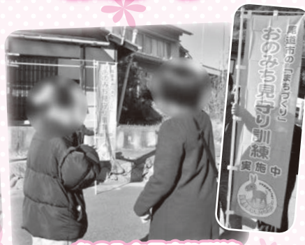
おのみち見守り訓練