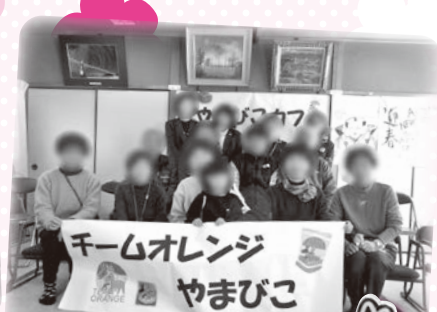
チームオレンジ整備事業