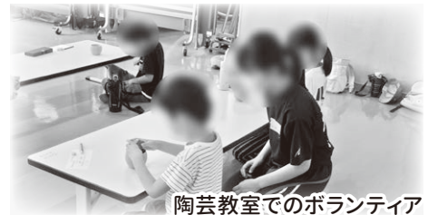
陶芸教室でのボランティア

河内公民館（御調）では、8月18日に10名の高校生が、乳幼児の託児体験をしました。普段小さな子どもと関わる機会が少ない生徒が多く、貴重な体験になったようです。この体験を活かして、保育士を目指したいという感想もありました。