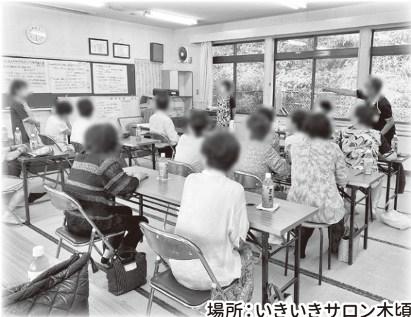
場所:いきいきサロン木頃

7月に木頃地区全域を対象にした「ふれあいサロンきごろ」が新しく立ち上がりました。毎月の集いをみなさん楽しみにしています。