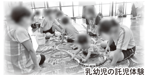
乳幼児の託児体験