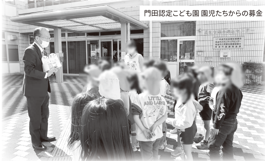
門田認定こども園 園児たちからの募金

今年も10月1日からはじまりました！ 皆さまからのあたたかいご支援・ご協力をお願いいたします。