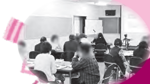
みらいサポーター養成研修

みらサポでは、ひきこもりに関する相談を受け、本人のペースを大切にしながら一緒に考えていきます。今年度、ひきこもりの正しい理解・啓発として「ひきこもりサポーター養成講座」や「みらいサポーター養成研修」を行いました。