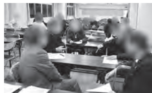
「向こう三軒両隣の付き合いが大切」「さりげない見守りならできるで」話し合うことで様々な気づきが生れます。

令和5年11月28日(火)栗原・久山田地区で地域について考える場として、「あんしん栗原・久山田(第2層協議体)」が立ち上がりました。栗原・久山田地区社協のメンバーと市社協、西部包括が連携し、安心して暮らせる地域について考えていきます。まずは、高齢者の安否確認をする「見守り隊」の活動を発展させ、高齢になっても住み慣れた地域で安心して暮らせる地域づくりに取り組んでいきます。