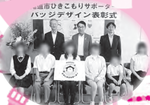
尾道市ひきこもりシンボルマーク