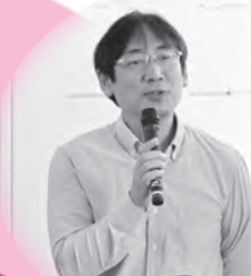
ひきこもりサポーター養成講座